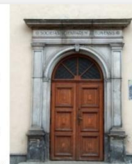
Pałac Czartoryskich w Lublinie. Portal.

Styl w architekturze powstały we Francji w połowie XII wieku trwający w sztuce europejskiej do połowy wieku XV. Był to od początku styl architektoniczny, co znalazło wyraz w konstrukcji opartej o sklepienie krzyżowo-żebrowe, przypory i łuki przyporowe oraz łuki ostre. Zastosowanie tego systemu konstrukcyjnego pozwoliło na wzniesienie strzaskłych i smukłych kościołów z wielkimi oknami witrażowymi i różnorodnymi, ozdobnymi sklepieniami (między innymi gwiazdastymi, siedłowymi, kryształowymi). Podstawowym materiałem budowlanym był kamień, cegła i drewno.