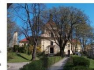
Kościół św. Elżběty Przekła w Lublinie