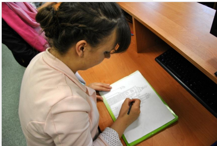
Rysunek 5. Rysowanie pamięciowe budynków wyjątkowych.

8. Następnie zapoznani się z planami i osadzeniem rynku lubelskiego. Bardzo pomocna w tym działaniu była wirtualna wycieczka po rynku Starogo Miasta. Uczniowie oglądali