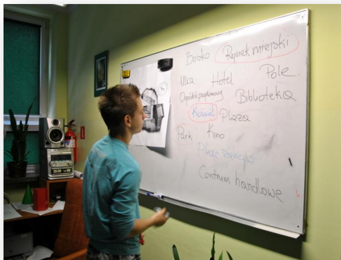
Rysunek 6. Zagadnienie przestrzeni publicznej i terenów prywatnych.

wypukła. Początkowo ze wszystkich naroży Rynku wybiegały po dwie ulice. Wraz z upływem czasu i licznymi przekształceniami zabudowy Rynku część ulic została zabudowana. Dowiedzieli się, iż rynki średniowiecznych miast pełniły funkcje handlowe, służył również jako miejsce manifestacji prawa i publicznej egzekucji. W podziemiach ratusza znajdowały się cele, gdzie przetrzymywano więźniów oraz specjalne pomieszczenie, gdzie mistrz katowski dokonywał przesłuchań.