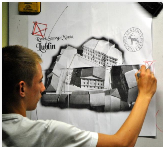
Rysunek 7. Rynek Starego Miasta - wyznaczenie dawnych murów i bram obronnych.