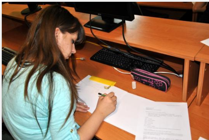
Rysunek 3. Tworzenie map pamięciowych.

ich wygląd oraz przeznaczenie. Po dyskusji i podzieleniu się opiniami co do charakterystyki budynków, naszkicowali mapy pamięciowe swojej drogi do szkoły, uwzględniając omówione wcześniej zasady rysowania planów terenów miejskich.