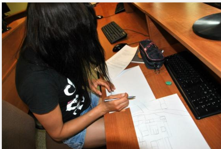
Rysunek 2. Tworzenie map pamięciowych.

3. Przeprowadzono ćwiczenie wykorzystujące wyobraźnię. Uczestnicy zajęć odtworzyli w pamięci schemat drogi z domu do szkoły. Wymienili budynki, które mijają po drodze i omówili