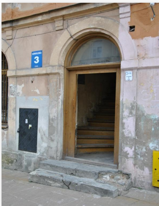
Rysunek 10. Ulica Kowalska – wejście na klatkę schodową. Budynek z 1870 r.

metalowych, co jak zauważyli uczestnicy wycieczki, dobrze oddaje charakter tej niegdyś żydowskiej ulicy, która jako nieliczna ocalała po zawierusze II wojny światowej.