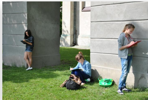
Rysunek 3. i 4. Prace nad szkicami panoramy Starego Miasta i Zamku.