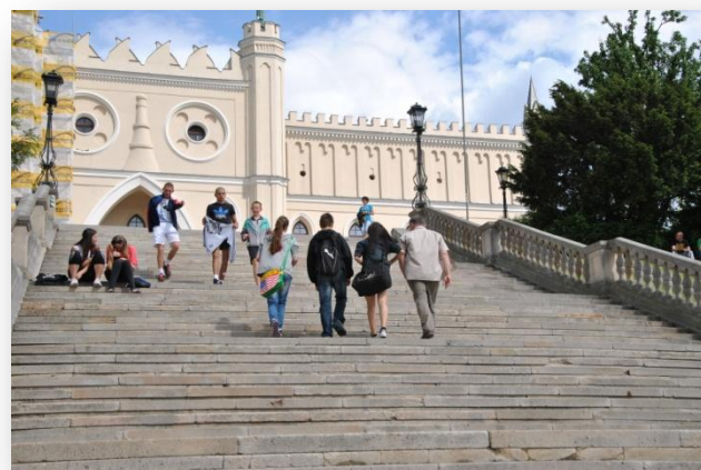
Rysunek 5. Widok Zamku Lubelskiego front zamku w stylu neogotyckim z cechami neoklasycystycznymi z blankowana attyka nawiązująca do renesansowej historii zamku.

5. Kolejnym zadaniem było utrwalenie w formie szkicu i na fotografii widoku ze Wzgórza Zamkowego na Stare Miasto i nieistniejącą od 1943 roku dzielnicę żydowską, która niegdyś otaczała Wzgórze Zamkowe. Uczniowie przywołali w pamięci wirtualną wycieczkę, jaką odbyli na wcześniejszych zajęciach po makiecie wykonanej przez Ośrodek Brama Grodzka Teatr NN i ze zdziwieniem stwierdzili, że Lublin w czasie XX w. zmienił się diametralnie.