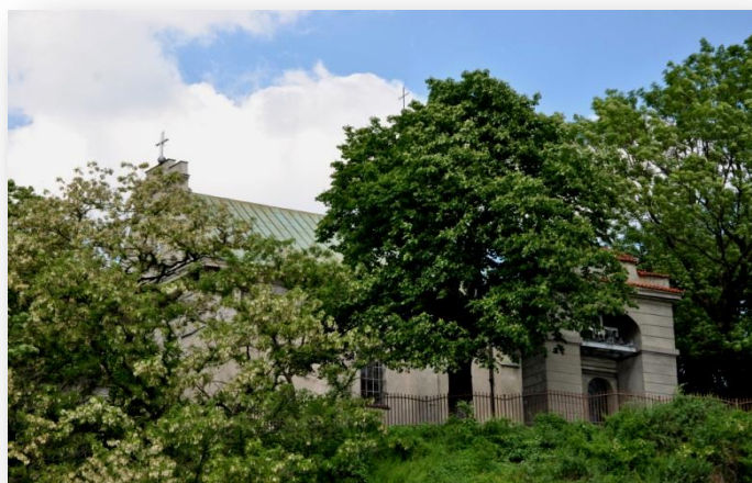
Rysunek 1. Wzgórze Czwartkowe – kościół św. Mikołaja.

1. Na początku uczniowie zostali podzieleni na dwie grupy. Pierwszej grupie zostało przydzielone zadanie wykonywania dokładnej dokumentacji fotograficznej miejsc i budowli, które odwiedzimy. Ponadto mieli oni również zaznaczyć na mapie miasta miejsca, które zostały sfotografowane. Druga grupa miała za zadanie zilustrować charakterystyczne cechy badanej okolicy oraz nanosić na mapki informacje o widzianych obiektach, z uwzględnieniem ich położenia geograficznego.