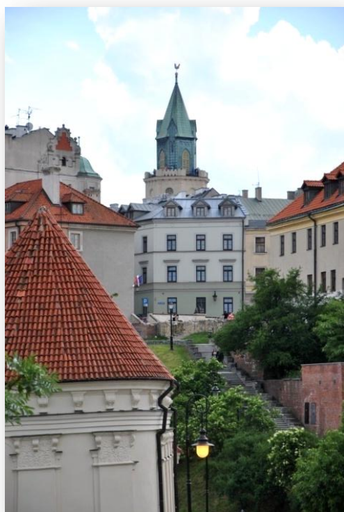
Rysunek 8. Widok na Stare Miasto i Wieżę Trynitarzka od strony Wzgórza Zamkowego. Na pierwszym planie Latarnia Pamięci.

8. Uczniowie wykonali dokładną dokumentację fotograficzną ulicy i zrobili notatki dotyczące opisu budynków i ich funkcji. Grupa ilustratorów zatrzymała się u zbiegu ulic Kowalskiej i Lubartowskiej, by naszkicować kamienice, rysując linie dachów i zarysy Starego Miasta oraz Wzgórza Zamkowego.