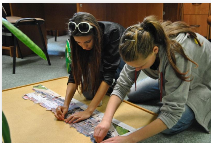
Rysunek 11. i 12. Prace nad wykonaniem obrazu elewacji Placu Zamkowego.

10. Po powrocie do szkoły uczniowie dokonali przeglądu wykonanych fotografii i szkiców. „Rysownicy” zostali poproszeni