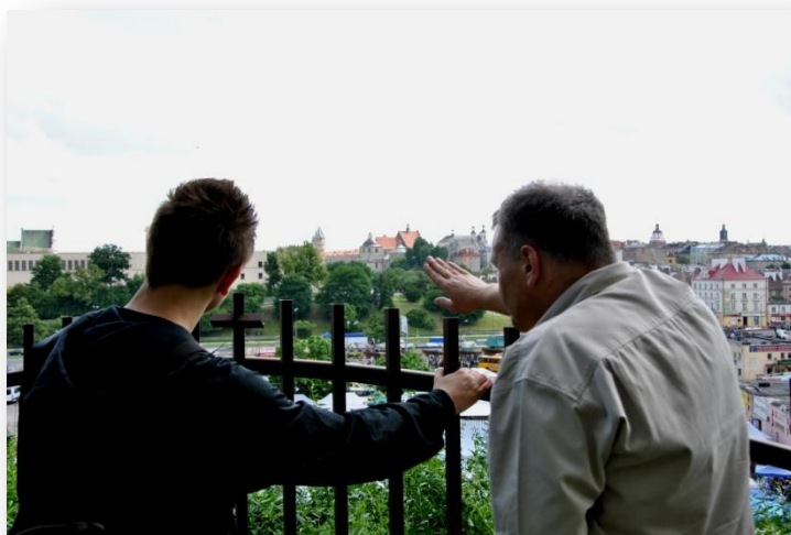
Rysunek 2. Widok ze Wzgórza Czwartkowego na panoramę miasta.

2. Wycieczka rozpoczęła się u podnóża Wzgórza Czwartkowego, gdzie z ulicy Ruskiej (jednej z najstarszych ulic Lublina) fotografowaliśmy stojący na jego szczycie kościół pod wezwaniem św. Mikołaja. Wzgórze to właśnie kolebka naszej społeczności. Bazując na wiedzy nabytej na poprzednich zajęciach, uczniowie potrafili określić, iż parafia istnieje od co najmniej XV wieku, a pierwsza świątynia została założona prawdopodobnie przez księcia Mieszka I w 986 roku (obecna budowla pochodzi z XVI w., przebudowana została w połowie