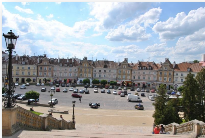
Rysunek 7. Pierzeja Placu Zamkowego. Budynki pochodzą z 1954 roku. Dawniej przebiegała tu główna ulica dzielnicy żydowskiej – ulica Szeroka.

6. Uczniowie skonfrontowali swoje wiadomości o zamieszkującej ten teren przez bez mała 700 lat gminie żydowskiej ze współczesnym obrazem miasta. Dużym zaskoczeniem dla nich była informacja, że przy ulicy Podwale znajduje się latarnia pamięci – „wieczna lampka”, która nigdy nie gaśnie, by przypominać mieszkańcom naszego grodu o żydowskim mieście, którego dziś nie ma. Uczniowie zainteresowali się także historią pozostałościami po drugiej baszcie obronnej zamku, która nazywana była żydowską, gdyż prawdopodobnie dawna gmina żydowska sprawowała nad nią opiekę.